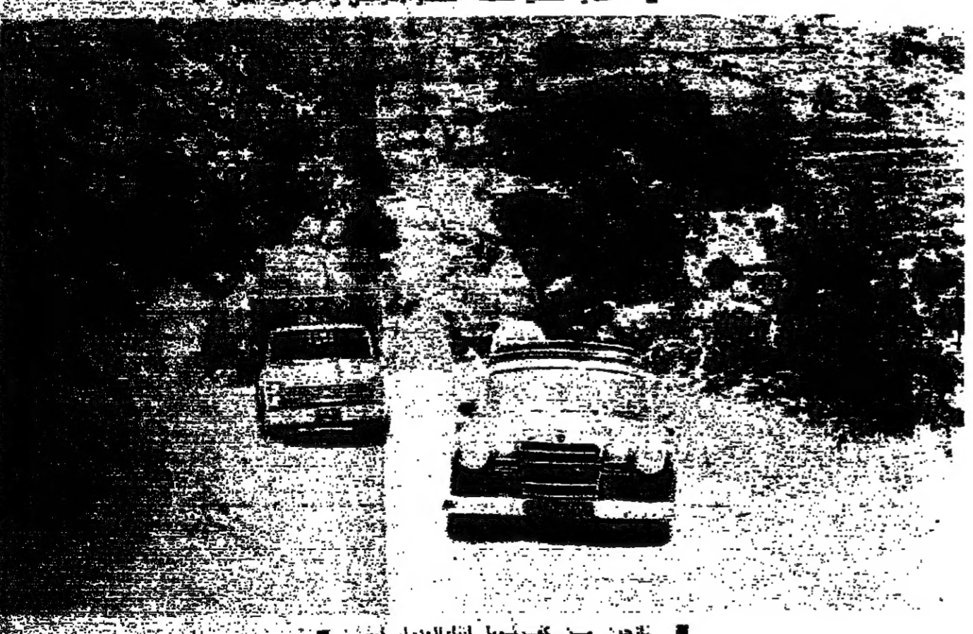
تزهون من كفرشوبا اثناء العدوان امين